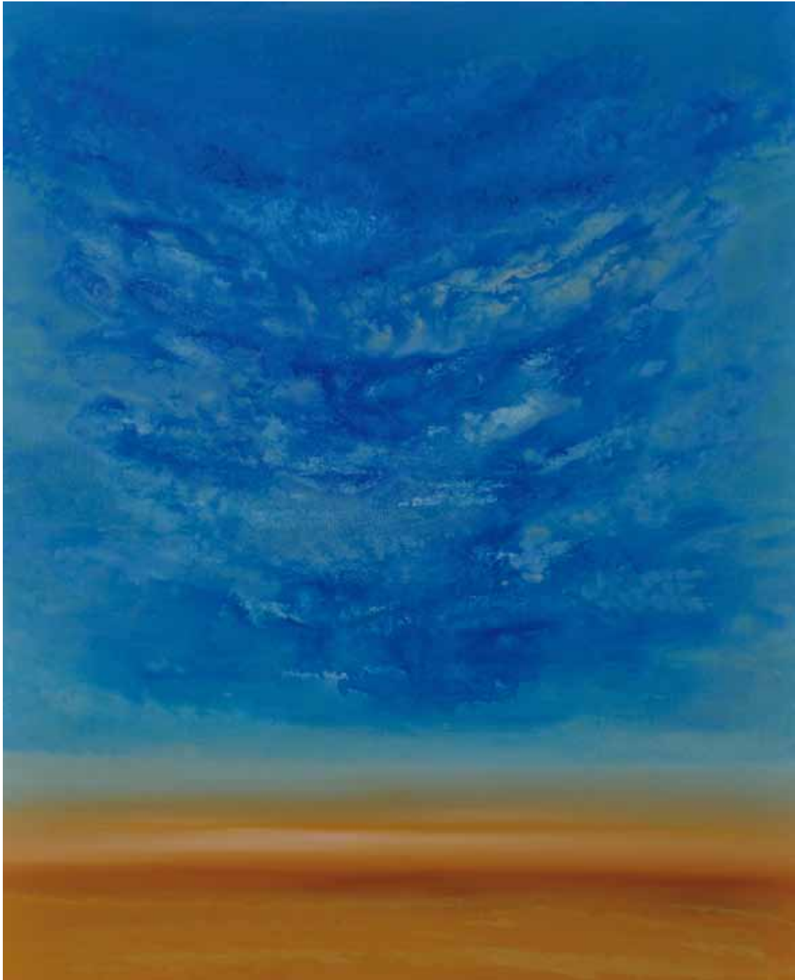
Wolkentraum 160x130 cm, 2010