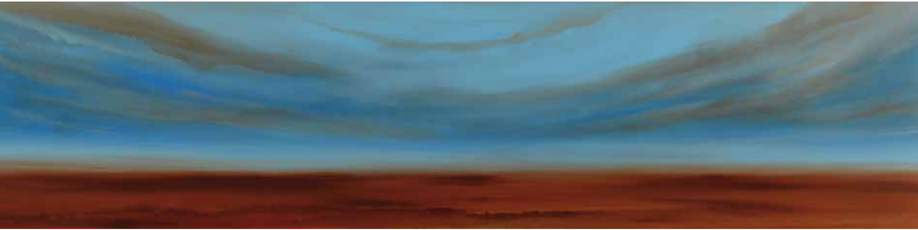
Horizon 60x240 cm, 2010