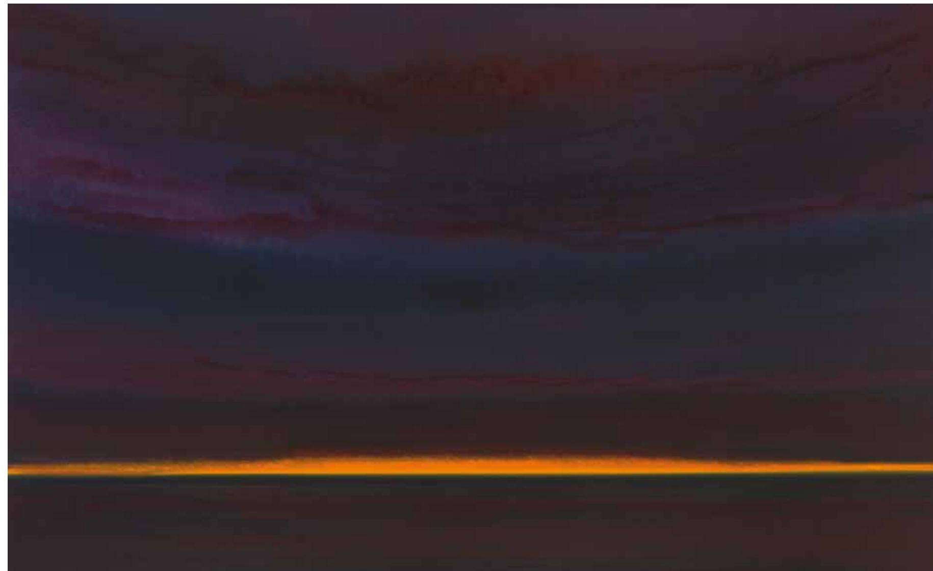
Traumhafte Nacht 110x180 cm, 2010