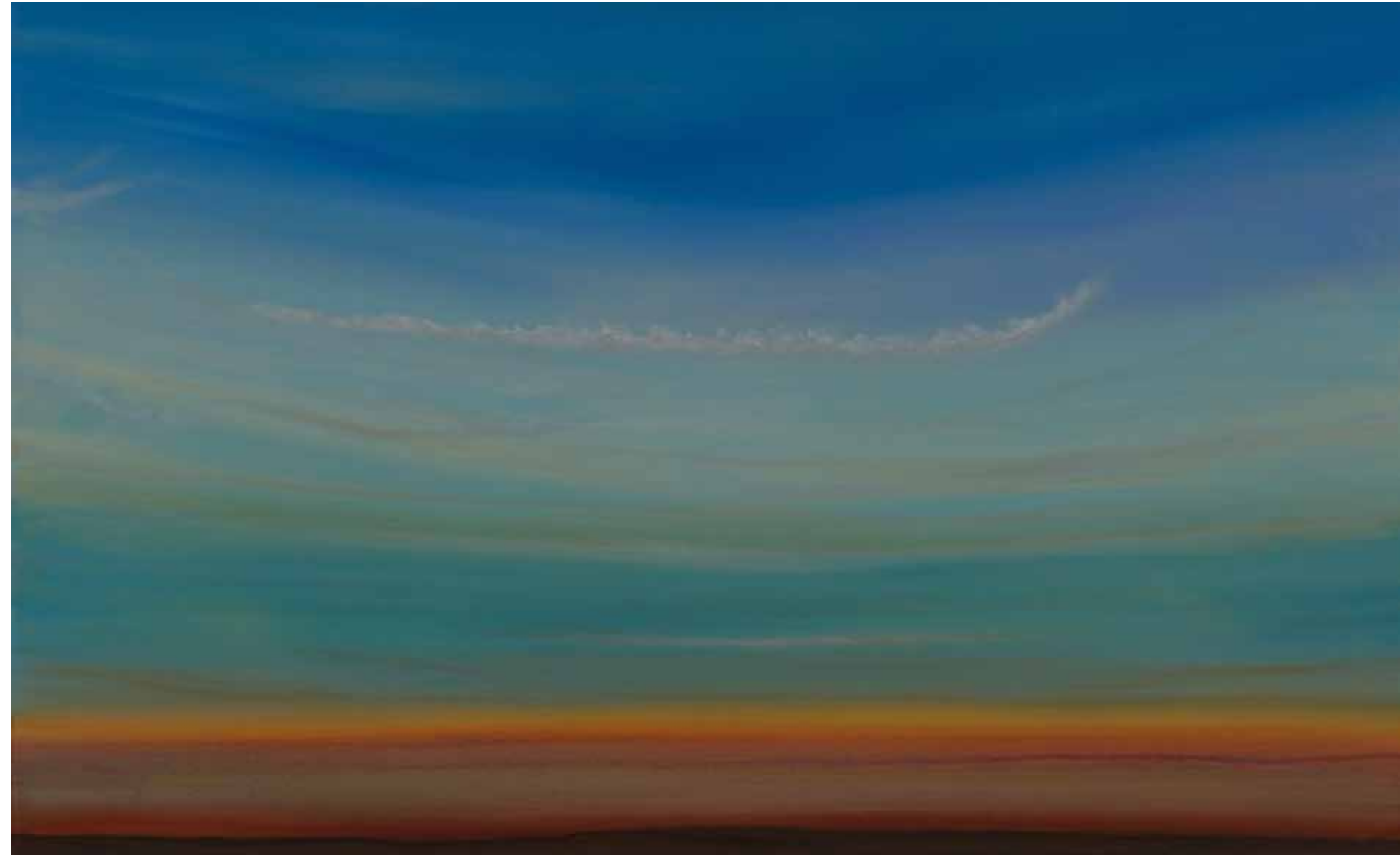
Abendstimmung 80x130 cm, 2010

When viewed under various lighting conditions, the acrylic glaze reveals ever changing new impressions. The discriminative eye experiences the calming effects of the sky.