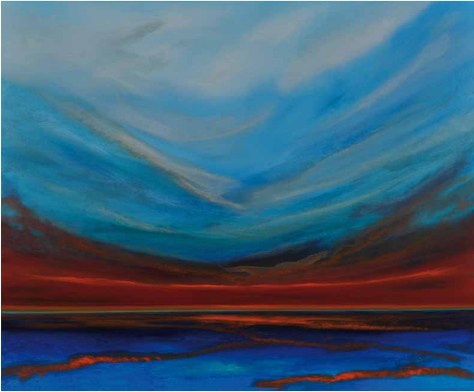
Abendrot 130x160 cm, 2010