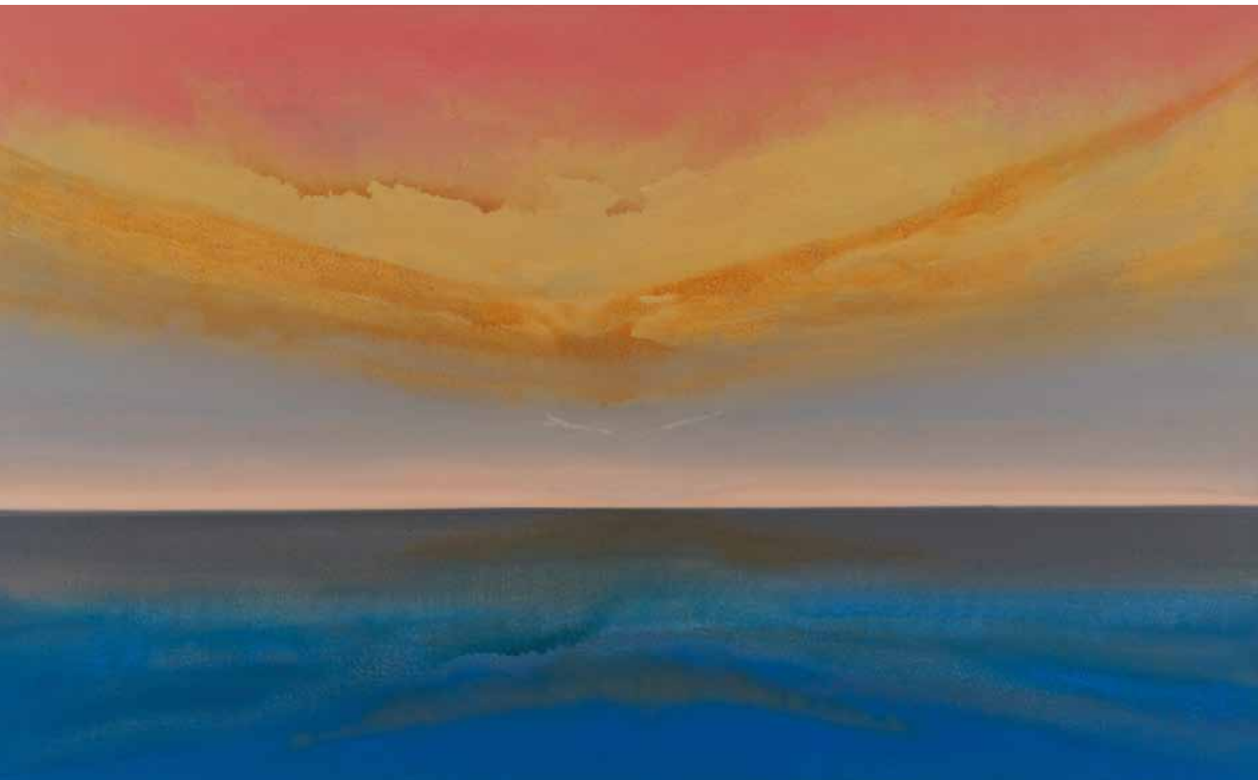
Himmliche Weite 110x180 cm, 2010