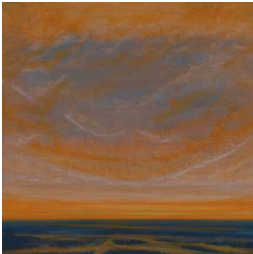
Wolkenspiel 100x100 cm, 2009