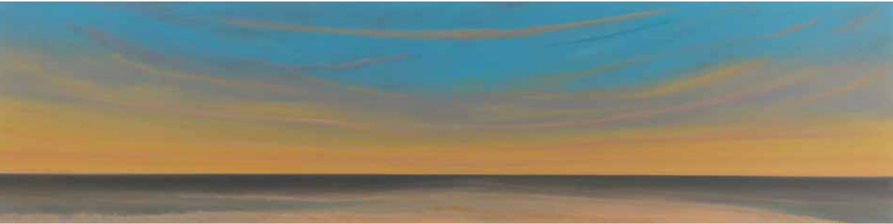
Fernes Licht 60x240 cm, 2010