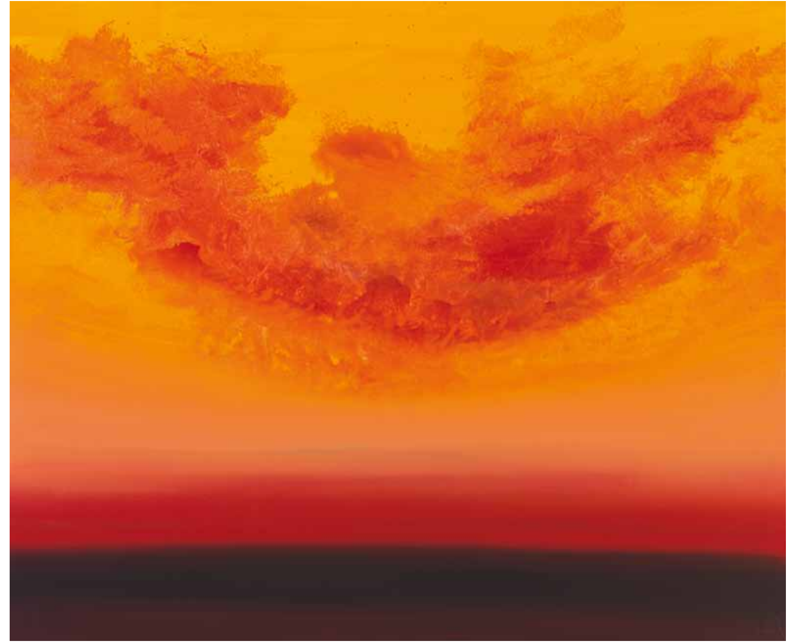
Sonnenkraft 130x160 cm, 2009