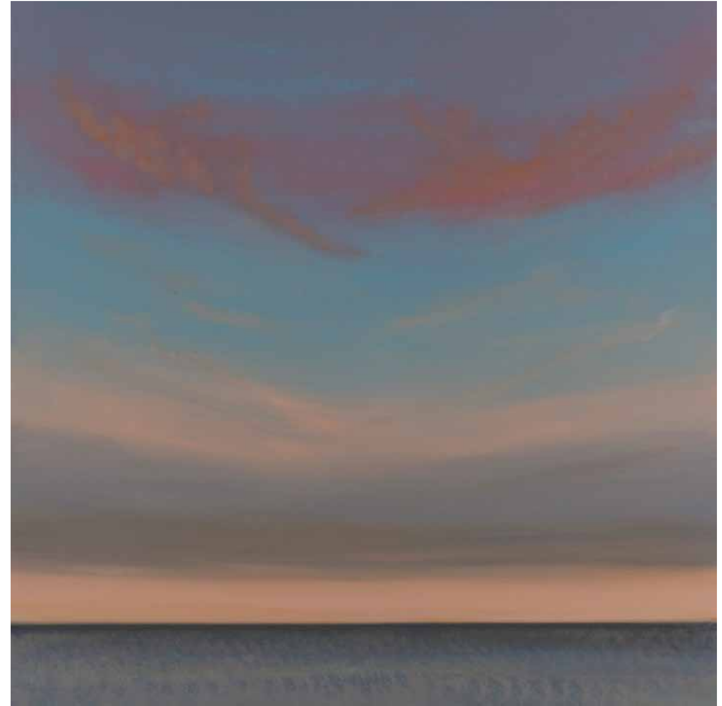
Heaven 150x150 cm, 2010