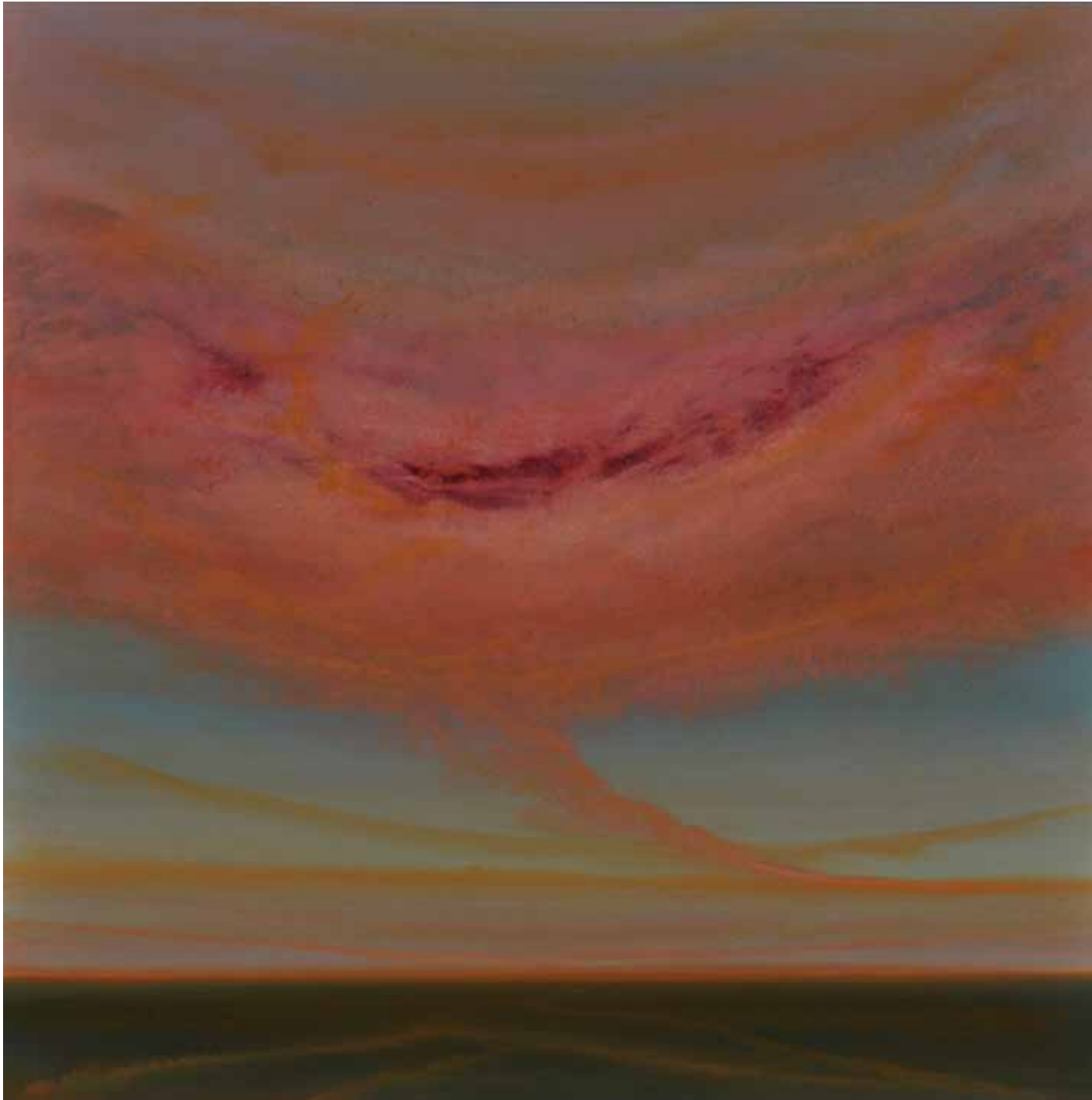
Wolkentraum 100x100 cm, 2009