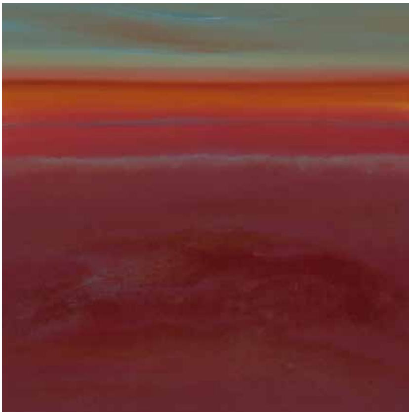
Wonderful place 80x80 cm, 2009