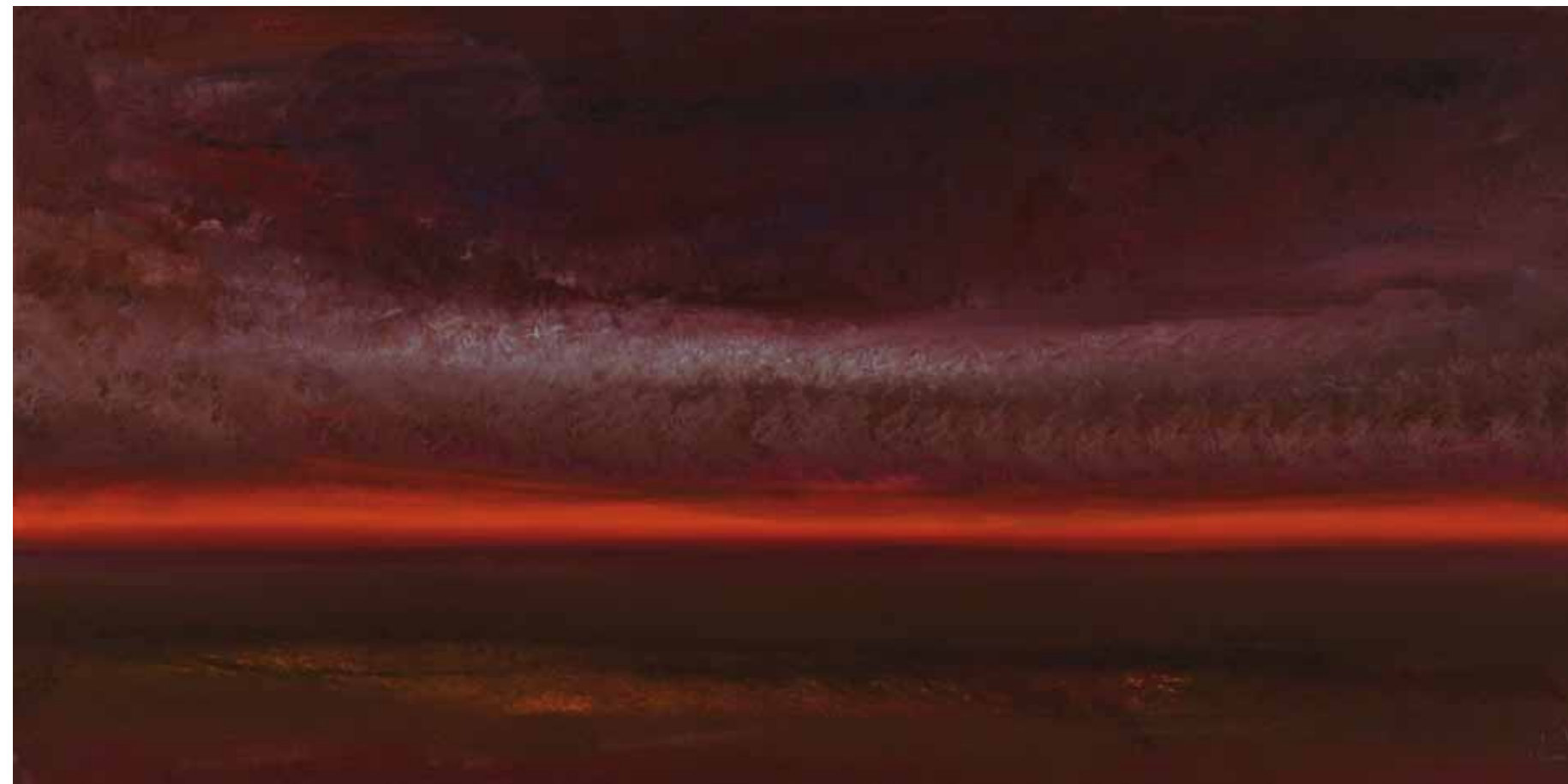
Glühende Nacht 75x150 cm, 2009