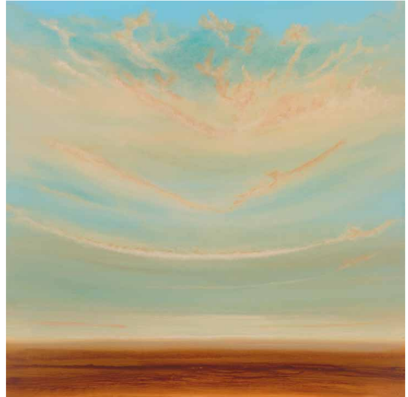
Sky of mine 150x150 cm, 2010

Sometimes it takes weeks until new directions are revealed to him in a way that enables him to continue and complete his work. For more than 16 years, Alain Mieg has used acrylic paints. Today he increasingly supplements this technique with handmade paints derived from pigments and emulsions.