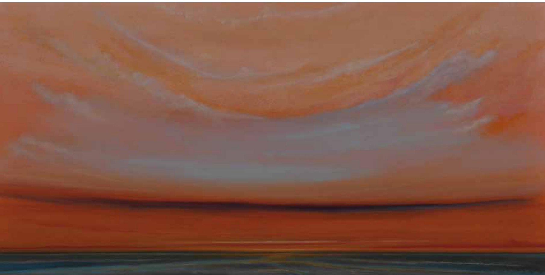
Silence 75x150 cm, 2009