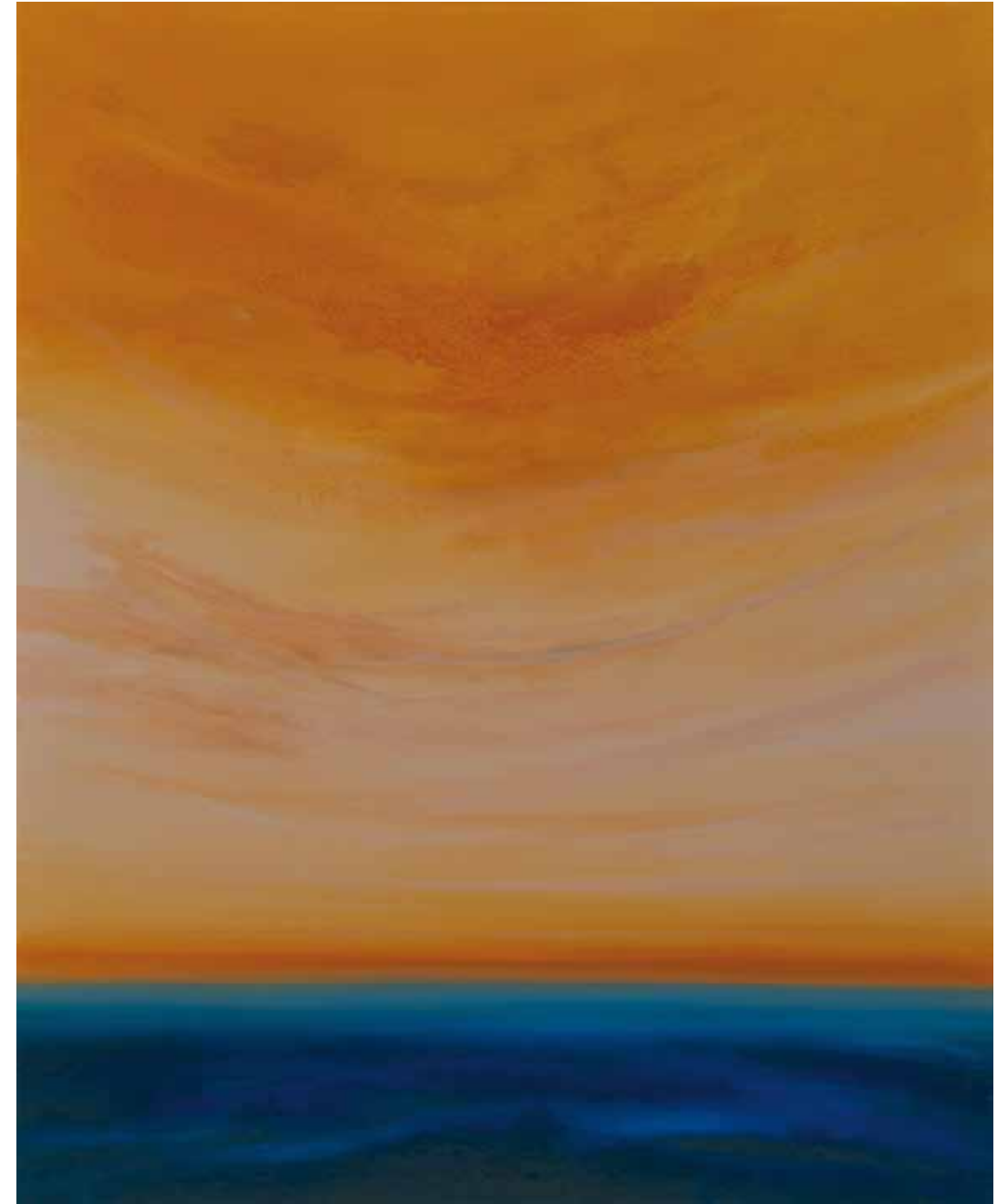
Meereshimmel 160x130 cm, 2009