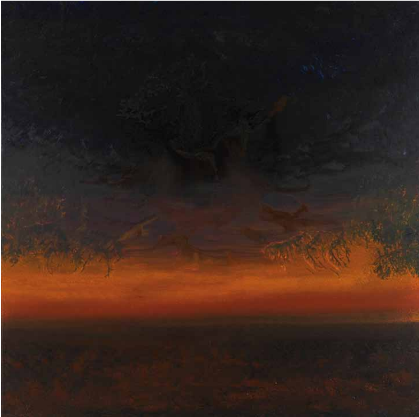
Abendkraft 150x150 cm, 2010