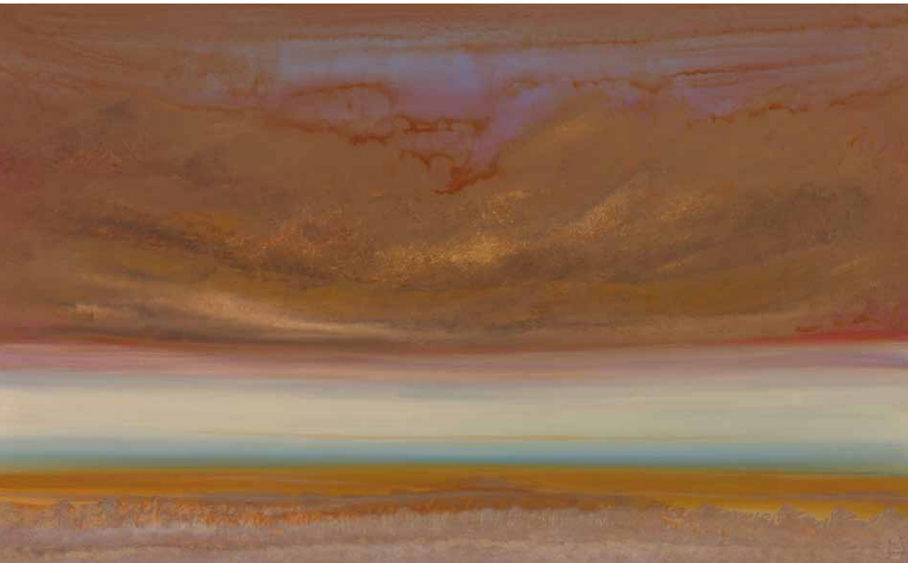
Ferne Ruhe 110x180 cm, 2010