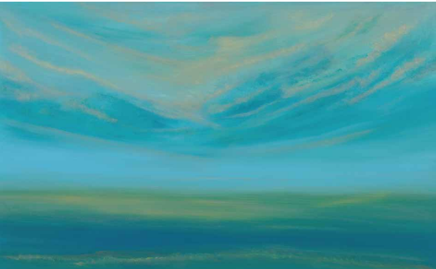
Sanfte Weite 110x180 cm, 2010

Bild auf Titelseite: A dream of sky 100x140 cm, 2009