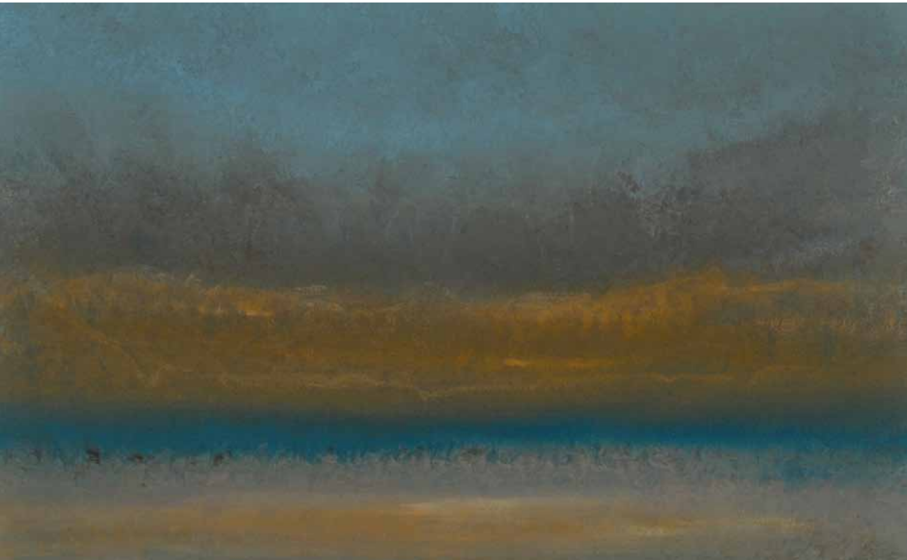
Meeresblick 80x130 cm, 2010