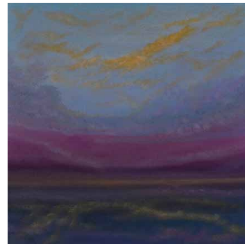
Mystic sky 80x80 cm, 2009