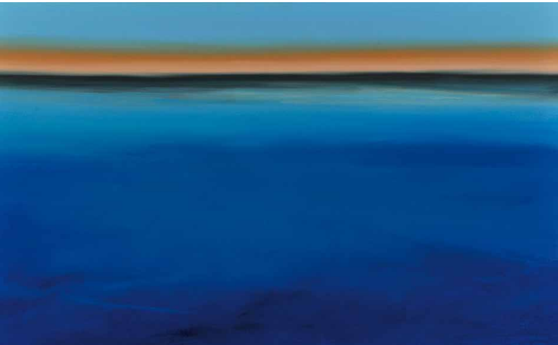
Deep blue sea 110x180 cm, 2009