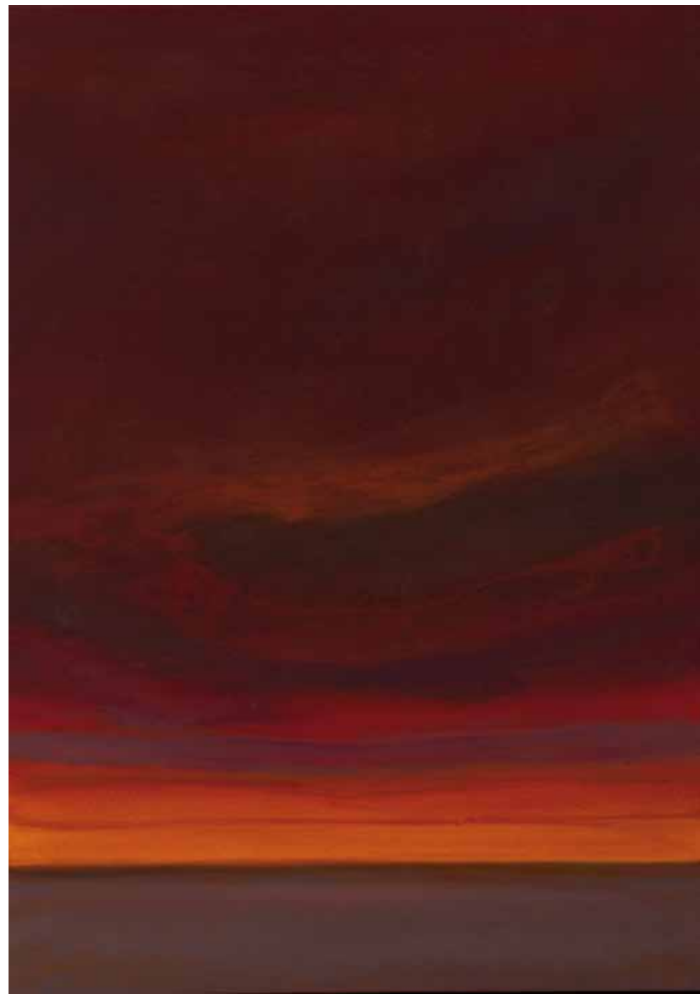
Red sky 140x100 cm, 2009