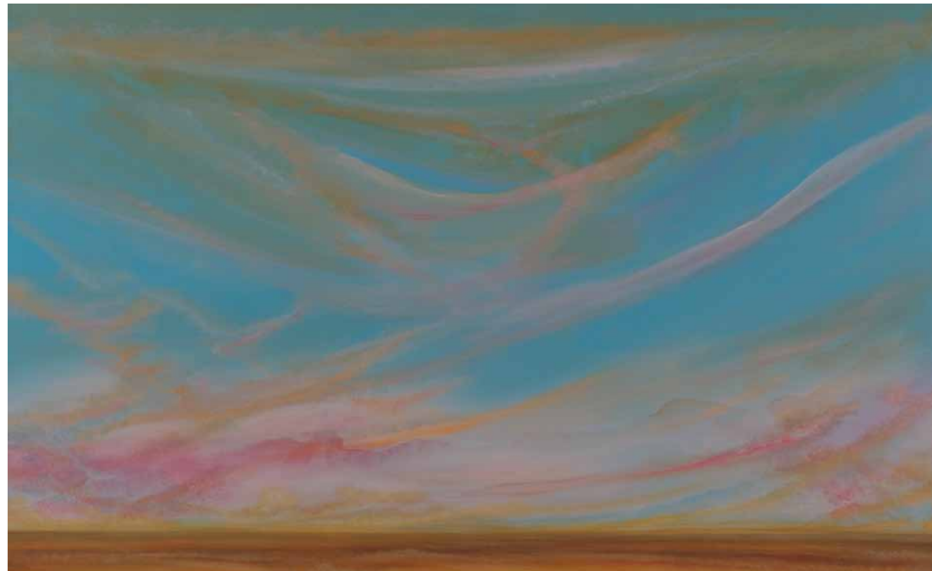
Fernes Land 110x180 cm, 2010