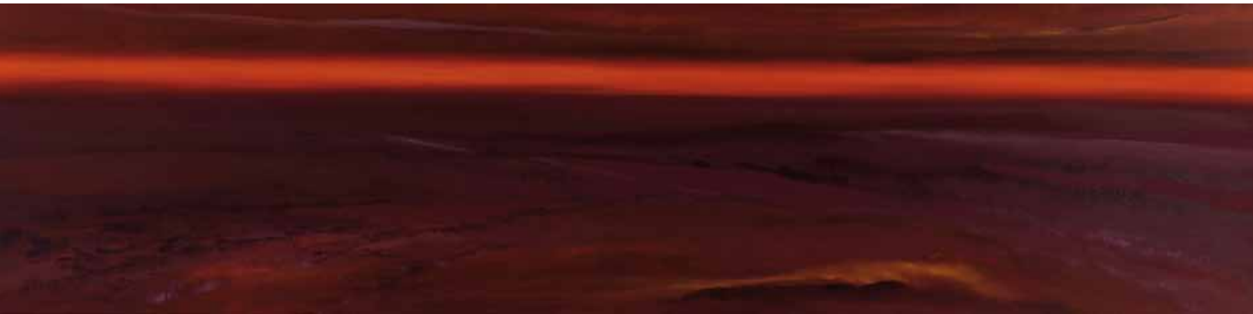
Weiter Horizont 60x240 cm, 2010