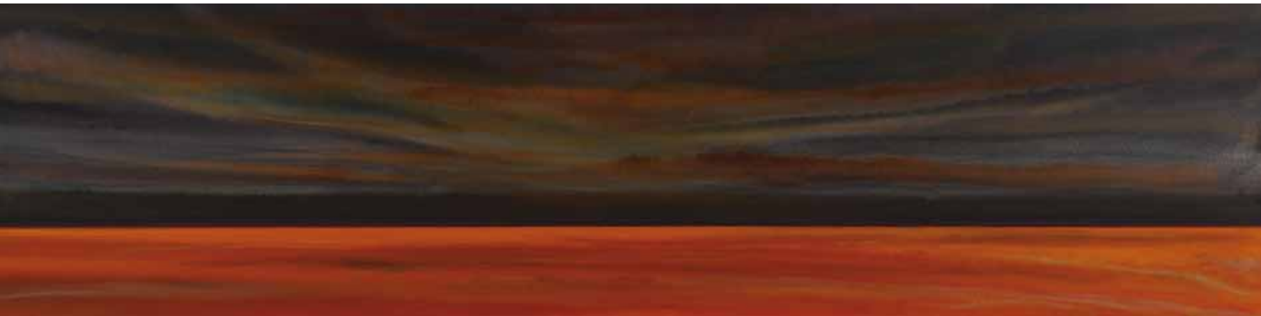
Leuchtendes Feld 60x240 cm, 2010