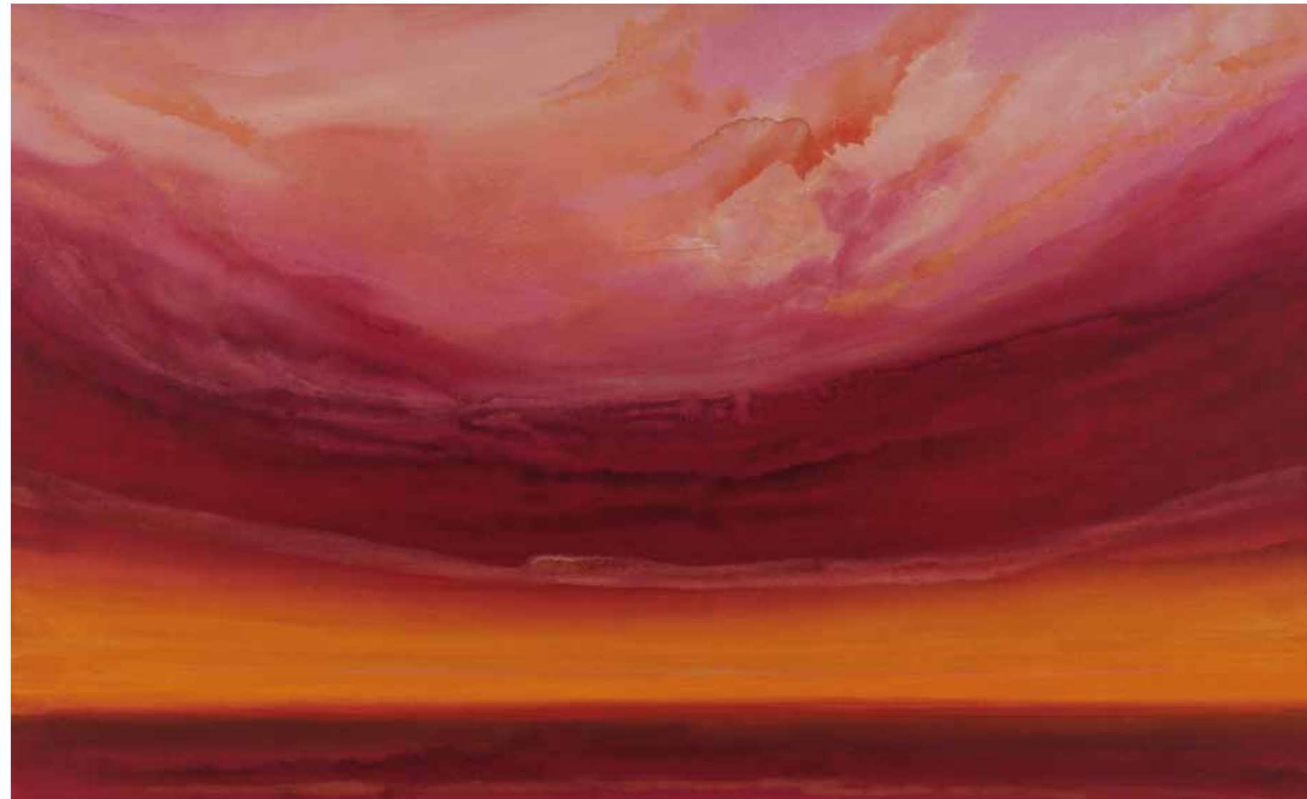
Wonderful red sky 110x180 cm, 2010