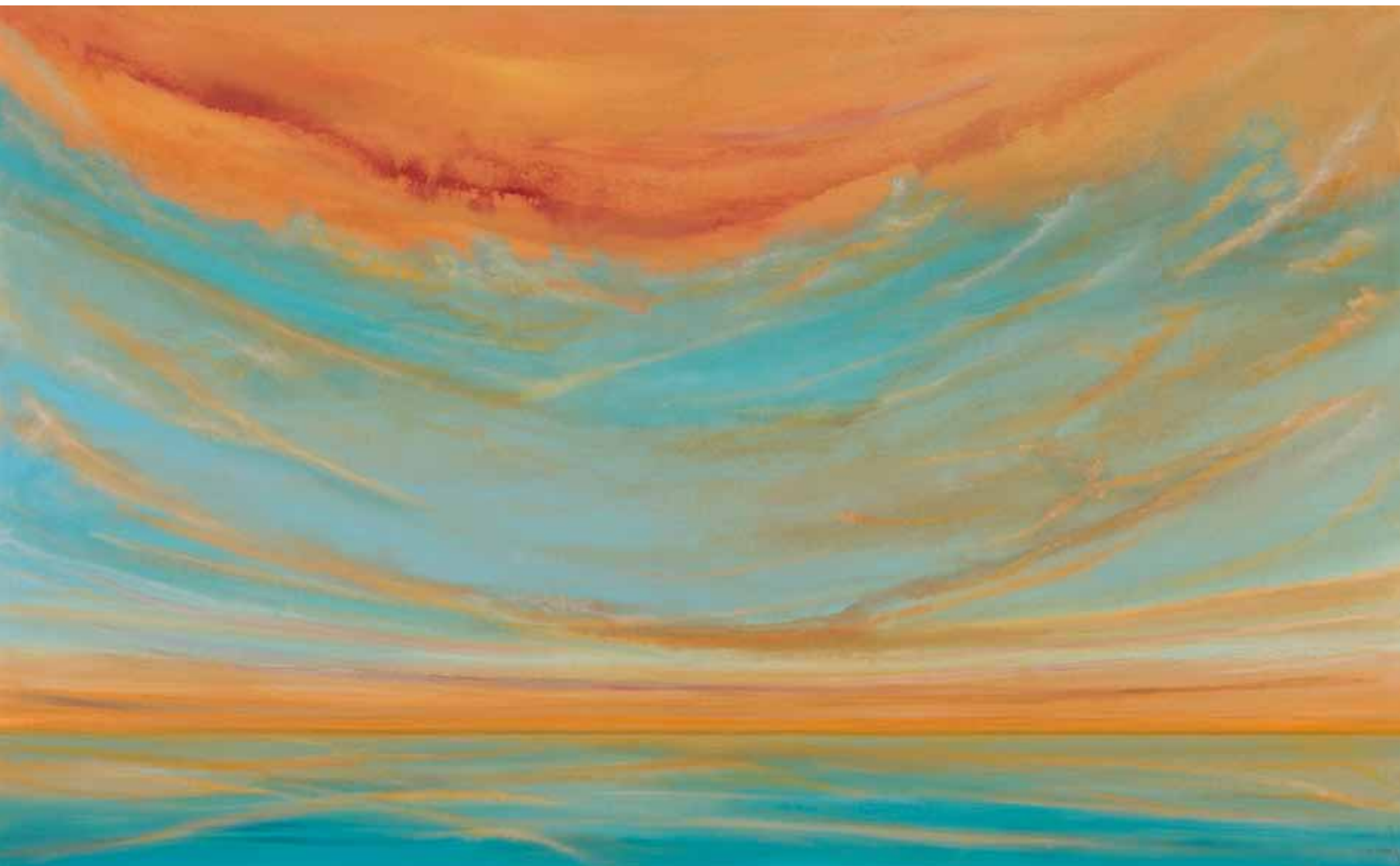
Himmelsspiel 110x180 cm, 2010