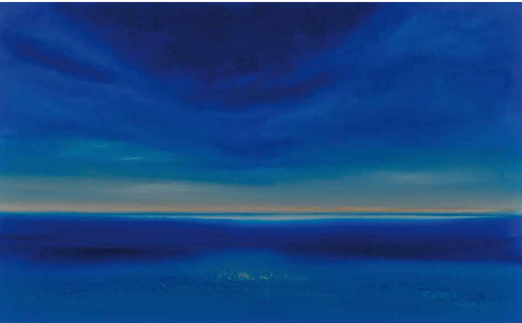
Meeresblick 110x180 cm, 2010