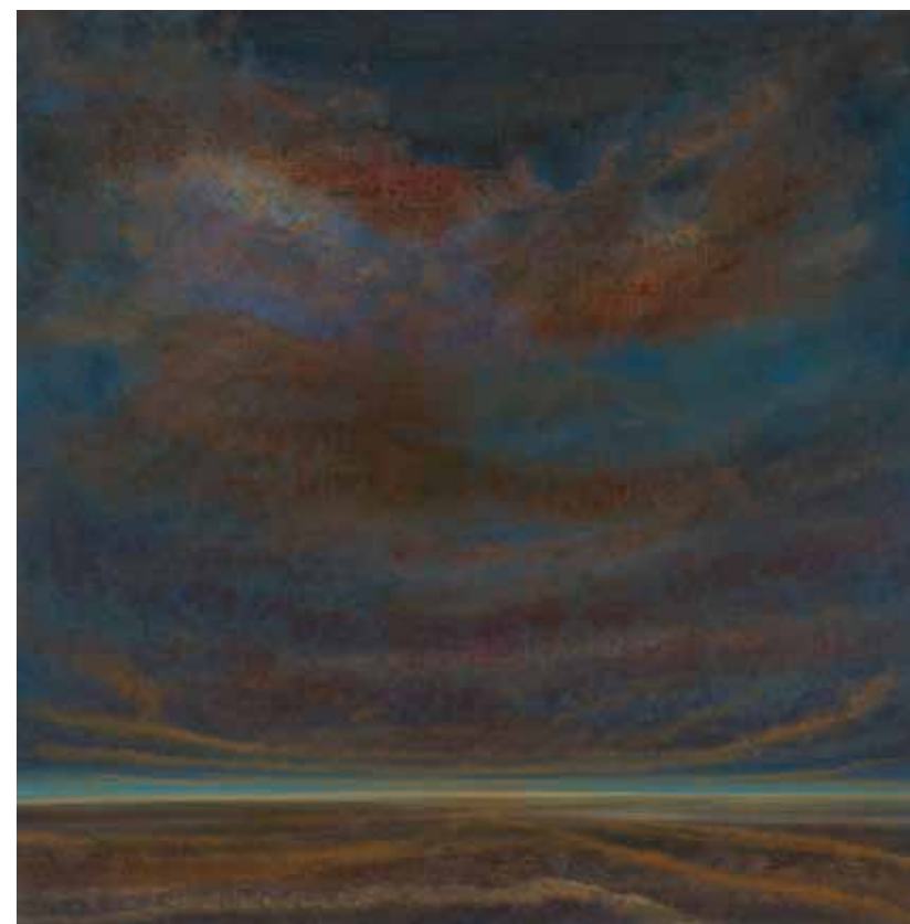
Wonderful sky 80x80 cm, 2009