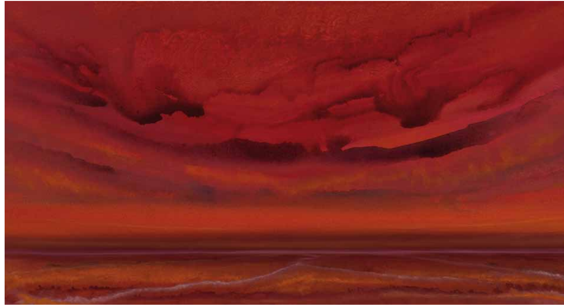
Dreamland 75x150 cm, 2009