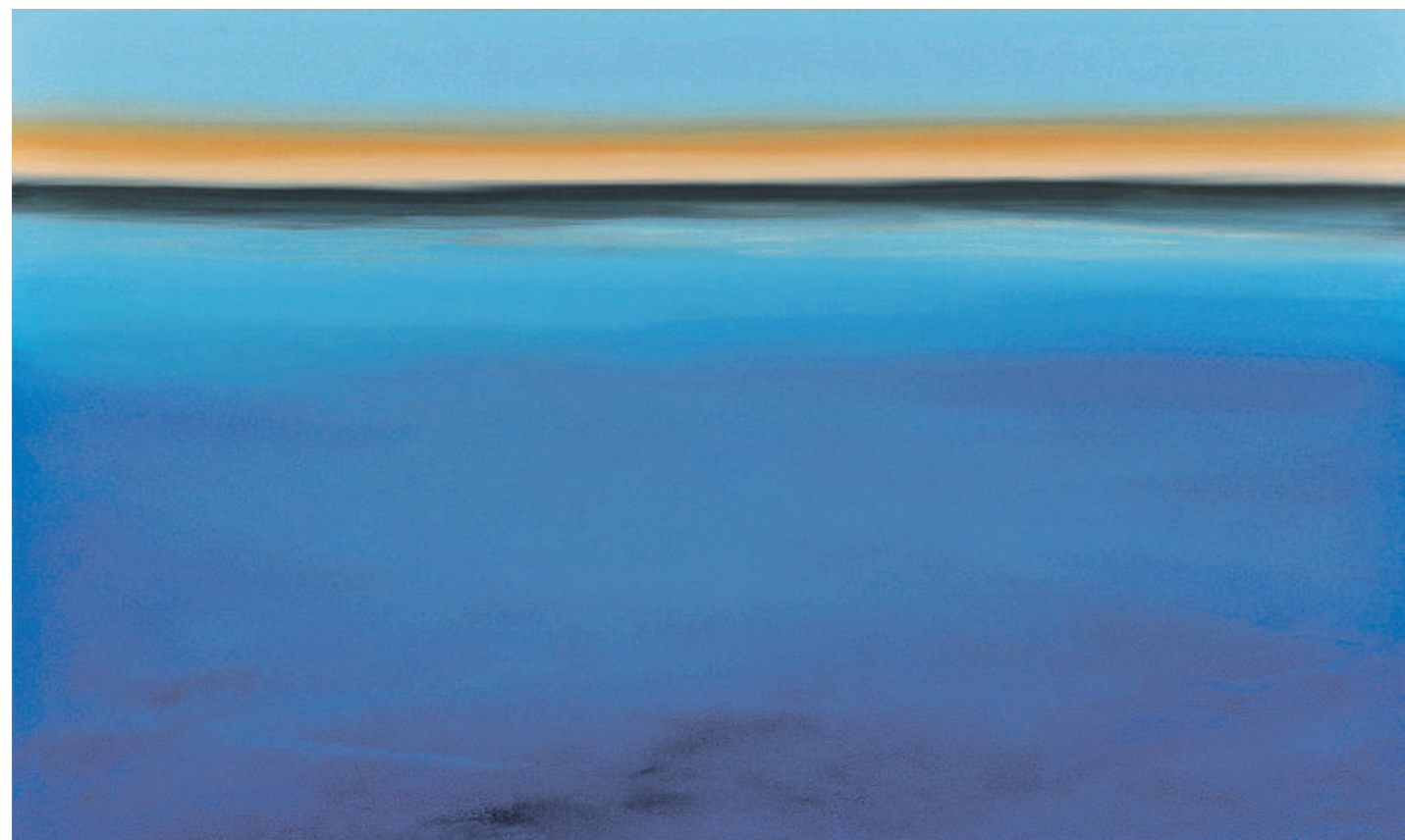
DEEP BLUE SEA, 110x180cm

Der Lenzburger Künstler Alain Miege setzt seine Traumwelten in einer ganz eigenen Maltechnik um. Je nach Lichteinfall entfalten die Gemälde unterschiedliche, aber immer magische Wirkungen.