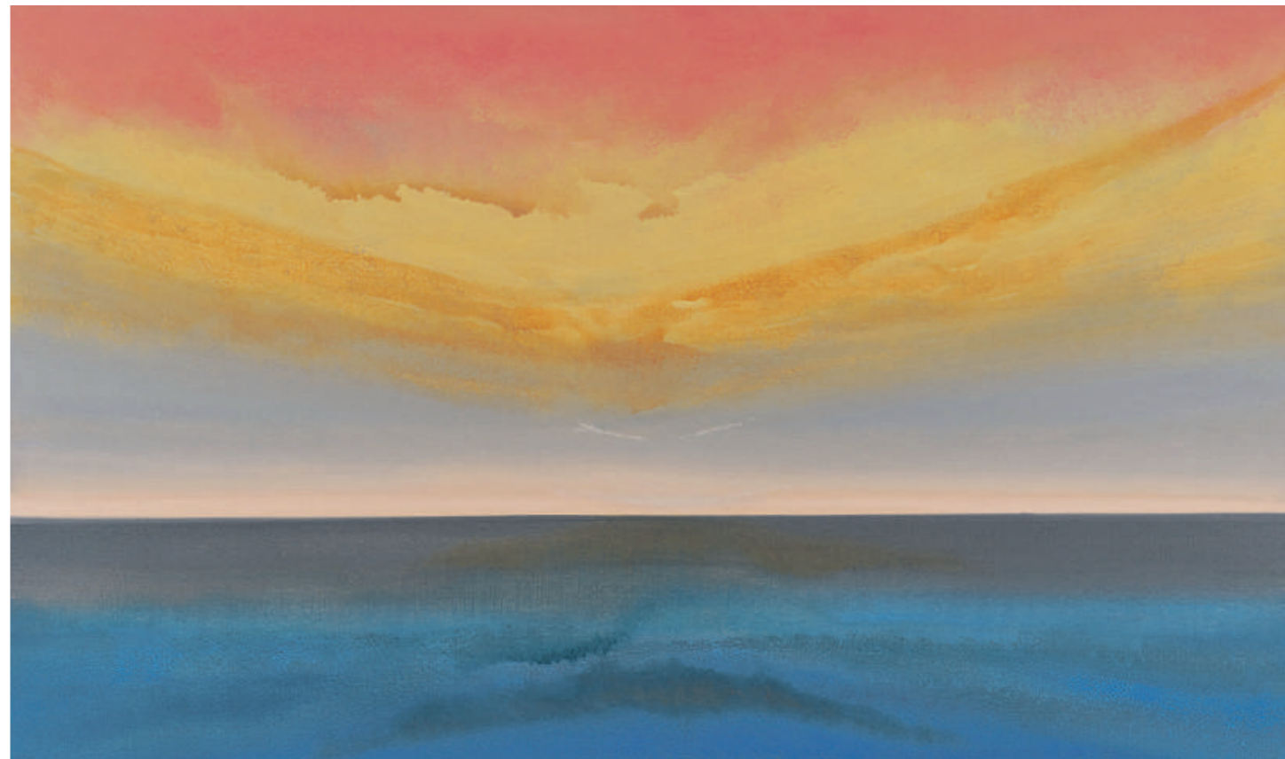
HIMMLISCHE WEITE, 110x180cm

strukturierende Pinseltechniken erreicht Alain Miege, dass die Bilder bei unterschiedlichem Lichteinfall völlig unterschiedliche Wirkungen entfalten, einmal melancholisch-düster wirken und dann plötzlich trostreich und erhebend. «Nicht nur je nach Tageszeit, sondern auch je nach Lebensphase, in der man sich befindet, hat jedes Bild eine unterschiedliche Aussage und Wirkung», sagt Alain Miege. In Arbeitsperioden mit jeweils rund sechs Malstunden pro Tag arbeitet der Maler an vielen Bildern gleichzeitig und kann anschliessend «wochenlang nur schauen.» Seit 2003 öffnet Alain Miege sein Atelier-Haus – übrigens das erste vom Architekten Pierre Zöllly realisierte Bauvorhaben. Nebst Atelierausstellungen mit gegen 900 Besuchern empfängt er nach Vereinbarung jederzeit Freunde seiner Kunst. «So können meine Gäste die Bilder in einem Wohn-Ambiente erleben und Sicherheit gewinnen. Sie werden beraten und ausgewählte Bilder werden Ihnen zuhause präsentiert und bestmöglich platziert. Das ist Teil meines Schaffens.» Für einen Künstler sehr ungewöhnlich, bringt Alain Miege zu einem potenziellen Käufer auch mal drei Bilder mit und findet dann an Ort und Stelle heraus, welches Werk am besten an den Ort passt, an dem es platziert werden soll.